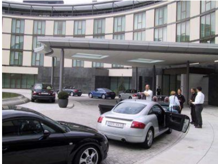
vor dem Hotel Ritz-Carlton

Bilder vom Besuch der Autostadt in Wolfsburg 2000