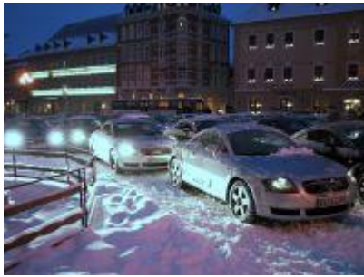
Die TT's auf dem Marktplatz

Zurück in Annaberg folgt die Blitzaktion "Foto für Werner". Torsten instruiert uns noch im Bus, wie die TT's auf dem Marktplatz umzuparken sind, damit er aus dem Fenster der Apotheke fotografieren kann. Die Aktion klappt erstaunlich gut. Und so sind ja dann auch die Fotos geworden.