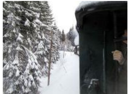
Schnee ohne Ende

In Oberwiesenthal scheint allen zu kalt zu sein. Kaum sind wir aus dem Zug gestiegen, verteilt sich alles auf die Gaststätten vor Ort.