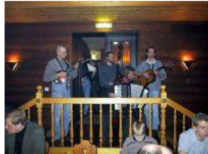
Die Chemser Bossen

Bis zum Hirsch der übrigens auch sehr vorzüglich gemundet hat, bleibt es noch relativ ruhig. Dann trifft die von Werner angekündigte Combo ein. Die Chemser Bossen spielen volkstümliches aus aller Herren Länder und natürlich dem Erzgebirge. Mit Schifferklavier, Kontrabaß, Gitarre, Balalaika und Klarinette wird die Stimmung angeheizt. Für J.P.'s Tabledance hat's zwar nicht ganz gereicht, aber er hat es für nächstes Jahr fest versprochen.